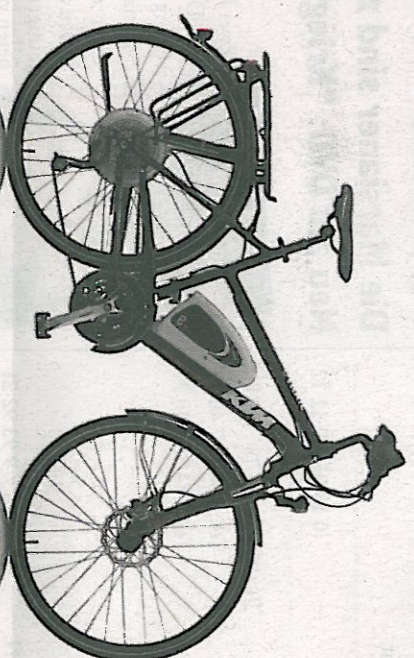
Von komfortabel bis flott: Die Bandbreite der aktuellen E-Bike-Generation ist groß.